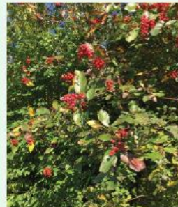
Echter Mehlbeerbaum Sorbus aria