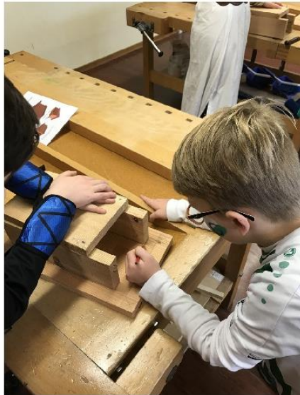
Hochmotivierte Primarschulkinder bei der Nistkastenproduktion.