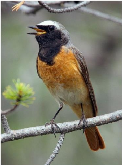
Die Muoler Landwirte/-innen engagieren sich für den Gartenrotschwanz.

46 innovative Landwirte/-innen und die politische Gemeinde Muolen engagieren sich im Vernetzungsprojekt Muolen. Damit soll ergänzend zur Produktion wertvoller Lebensmittel die Vernetzung von Biodiversitätsförderflächen (BFF) aktiv gefördert werden. Das laufende Vernetzungsprojekt wurde vom Kanton St. Gallen bis 2029 verlängert. Viele Landwirte/-innen bewirtschaften mehr als die geforderten 7 % BFF. Damit leisten sie einen sehr wichtigen Beitrag zur Biodiversität. Nachfolgend einige herausragende Beispiele für die vielfältigen Leistungen der Muoler Landwirte/-innen.