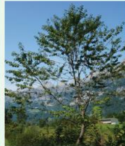
Vogelkirsche Prunus avium