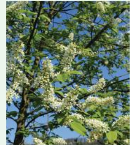
Traubenkirsche Prunus padus