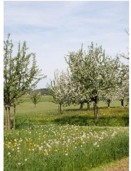
Obstgärten prägen die Landschaft in der Gemeinde Muolen - und werden vorbildlich gepflegt.