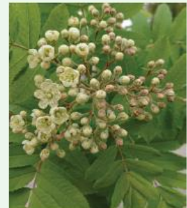
Speierling Sorbus domestica