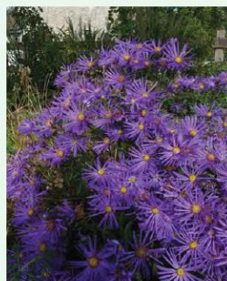
Berg-Aster Aster amellus