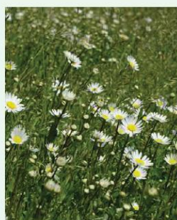
Gew. Wiesen-Margerite Leucanthemum vulgare