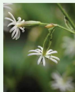
Nickendes Leimkraut Silene nutans