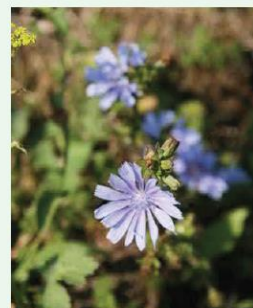
Wegwarte Cichorium intybus