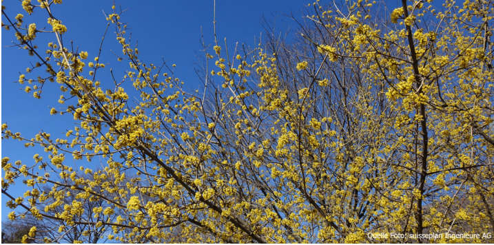
Im Frühling zählt die Kornelkirsche zu den wichtigsten Bienennährgehölzen.

Hecken sind ein wichtiges Vernetzungselement in der Landschaft und in der Siedlung sowie für viele Tiere ein wertvoller Lebensraum. Das dichte Unterholz, ein reiches Angebot an Beeren und Sämereien sowie artenreiche Krautsäume bieten neben Lebensraum auch Schutz und Nahrung. Hecken sind für die Tierwelt besonders wertvoll, wenn sie aus einheimischen Strauch- und Baumarten bestehen und einen hohen Anteil an Dornensträuchern aufweisen. Artenreiche Hecken prägen zudem unser Landschaftsbild und sorgen jährlich mit ihrem bunten Farbenspiel für einen Augenschmaus.