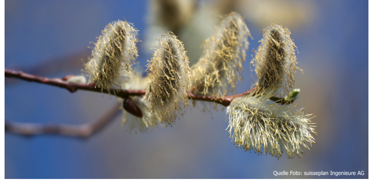
Die Sal-Weide ist bekannt für ihre flauschigen «Kätzchen».