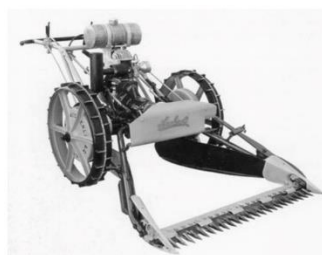
Unser Museumsschatz, die Aecherli-Mähmaschine