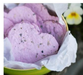
Leinsamen-Blumenpapier zum SELBERMACHEN